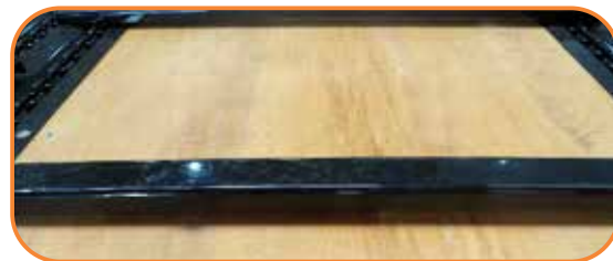
Producido con piso en madera naval.