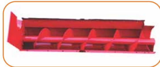
Su sinfín transportador es indicado para descargar varios forrajes como el maíz, el sorgo, la caña-de- azucar y una amplia gama de hierbas cortadas y picadas con hasta 7 mm.