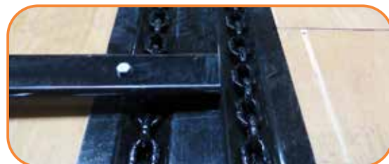
Cadena de acero especial, durable y de fácil mantenimiento.